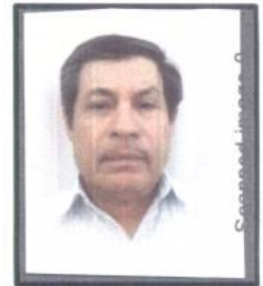
FOTO DEL SOLICITANTE

(DIRECCIÓN DE REGLAMENTOS FISCALIZACIÓN Y CONTROL.)